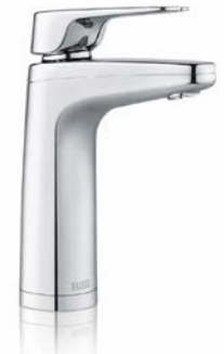
XL dispenser met hendel